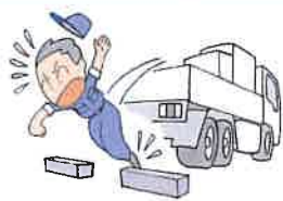
荷役作業安全対策(事業者用)