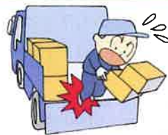
荷役作業重大災害対策